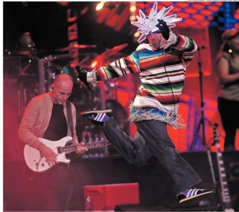
El vocalista Jay Kay bailó y disfrutó del show al igual que el público.

El vocalista Jay Kay salió a escena con un chaleco multicolor en fondo blanco con flecos, guantes negros, jeans y el sombrero de puntas y luces que lo ha caracterizado en este tour "Jamiroquai Live 2017". Algunos miembros del público fueron sombrero pecu-